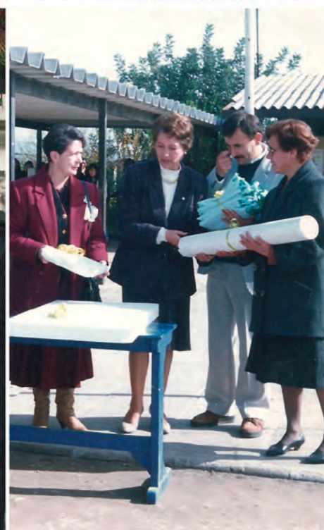
CONGRESO NACIONAL MUJER EMPRESARIA COMERCIO DETALLISTA Y TURISMO DE CHILE SANTIAGO, 22 AGOSTO 2013