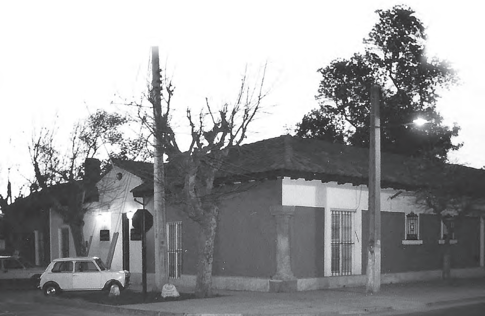
Actual sede de Cámara de Comercio de San Bernardo