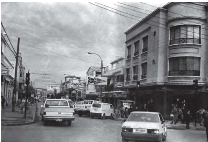
Esquina de Covadonga con Eyzaguirre

En la década de los 60 la arquitectura en su planificación de barrios, nuevas villas, poblaciones y centros habitacionales consideró de manera fundamental la actividad del comercio. En lugares estratégicos para la comunidad planificó espacios para locales comerciales, como se observa en calle América con Balmaceda, y en Villa Chena.