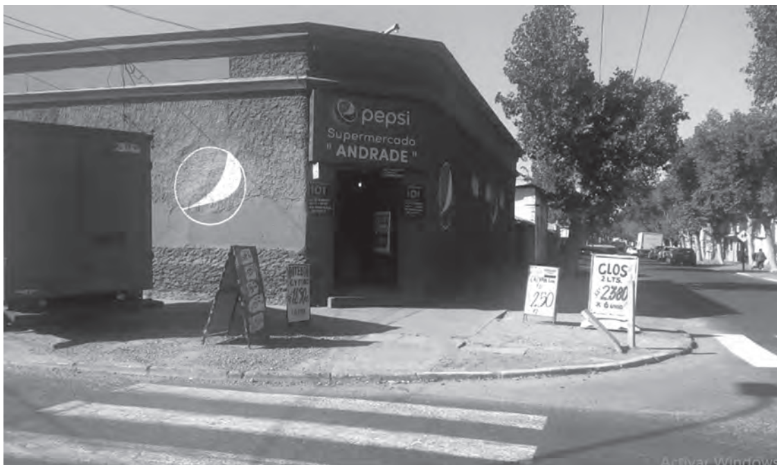
Supermercado Andrade. 12 de Febrero con Eyzaguirre

De ese modo podemos encontrar una serie de pequeños negocios que nacieron insertos en nuestros barrios y de alguna manera fueron punto de encuentro de dueños de casas y vecinos de esa comunidad, donde se conocían y conversaban las vivencias de las familias del sector, donde se difundía información de la vecindad, donde se dejaban recados o encargos, donde se compartían los sucesos de penas y alegrías. Negocios que manejaban el crédito mediante una libreta (el fiado) donde anotaban los pedidos del cliente-vecino y que eran cancelados cada fin de mes junto con el pago de sus sueldos. Créditos que no significaban ningún tipo de recargos o intereses, ni menos garantías para obtenerlos, solamente bastaban valores de confianza mutua y de honor a la palabra, negocios que demostraban su aprecio a la comunidad mediante la ya perdida costumbre de “la yapa”, que consistía en otorgar un pequeño regalo al cliente al realizar sus compras.