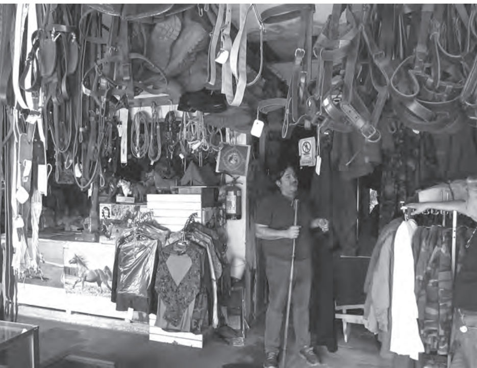
Talabartería El Caballo Blanco

Los rubros de comercialización en los cuales se han destacado son entre otros: Paquetería, mercería, bazar, fábrica de confecciones, gastronomía, productos excluidos del ejército, fábrica de zapatillas, fábrica de tubos de cemento y microvibrados, como en gastronomía.