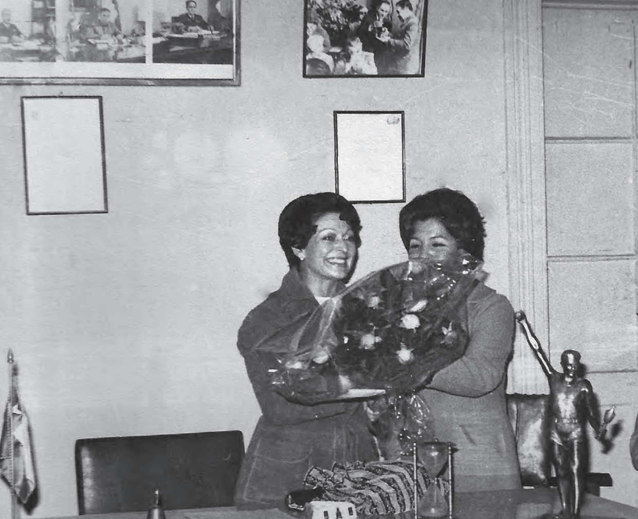
Las mujeres siempre han tenido una labor destacada en la Cámara de Comercio de San Bernardo.

Tanto la gestión realizada por sus primeros dirigentes, como también por la inminente entrada en vigencia de la normativa que obliga a los comerciantes de pertenecer a una asociación gremial para obtener patente y de esa manera poder realizar su actividad, permite que ya a 9 meses de su primera reunión, el número de socios inscritos en la Cámara sea de 937 comerciantes.