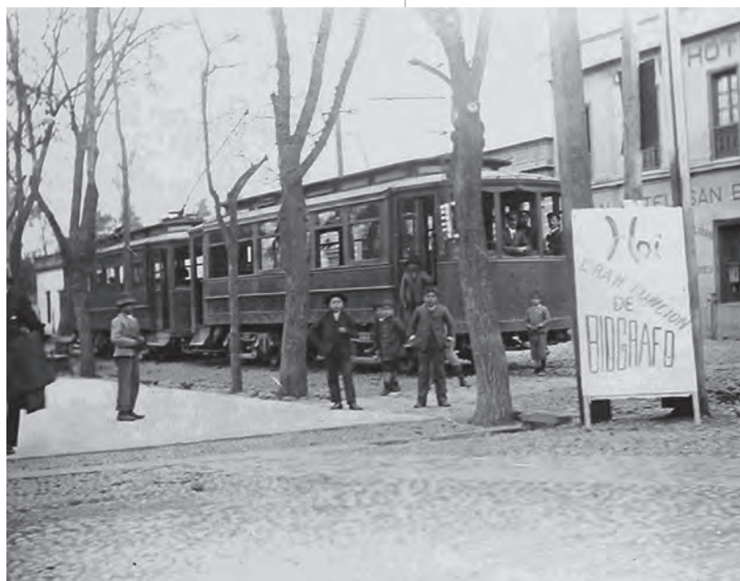
Paradero de Tranvía (1910). Calles Freire con Arturo Prat (actual edificio Gobernación). Y hotel San Bernardo

En cuanto a las actividades económicas que desarrollaba la población, eran variadas. Podemos constatar que, comparando los datos de los años 1878 y 1887, el mayor porcentaje corresponde a comerciantes (20,8% en 1878 y 17,4 en 1887), enseguida están los carpinteros (14,7% y 16%), los agricultores (14,7% y 10,5%), empleados (11,1% en ambos años) y zapateros (6% en ambos años).