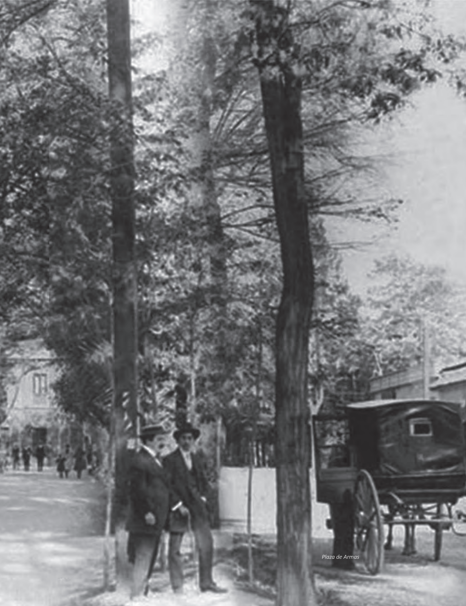
Plaza de Armas