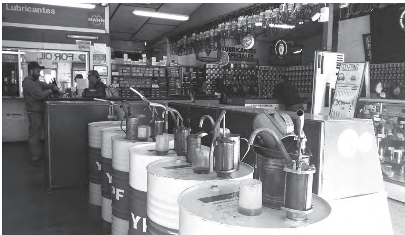
Gollerino / Central de Lubricantes / Plaza Guarello.

En San Bernardo hay tres grandes núcleos donde se concentra la actividad tuerca. Gran Avenida entre el paradero 40 y 41. Existe todo un centro de venta de repuestos, cambios de aceite y garajes. Plaza Guarello, que reúne talleres, locales para cambios de aceite y venta de repuesto, fundamentalmente. Y el sector comprendido en las calles Freire, San José, y Bulnes, donde se encuentran pinturas, radios, parlantes, neumáticos, talleres, parabrisas y talleres.