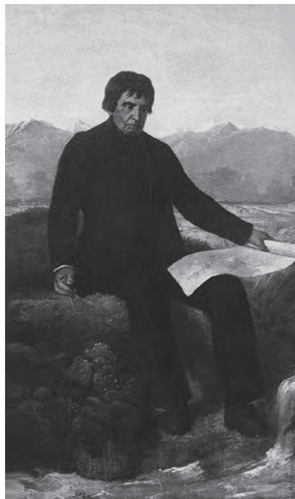
Domingo Eyzaguirre Arechavala, fundador de San Bernardo

El punto neurálgico de la actividad comercial de la joven ciudad se circunscribe al sector de la Plaza de Armas, donde en una primera etapa llegan en carretones y carretas los primeros comerciantes a ofrecer productos esencialmente consistentes en lo que otrora se conocía como frutos del país. Al poco andar, esta actividad realizada un tanto al aire libre, comienza a afianzarse en locales establecidos para esos efectos, los cuales preferentemente se instalan en las calles que dan frente a la Plaza.