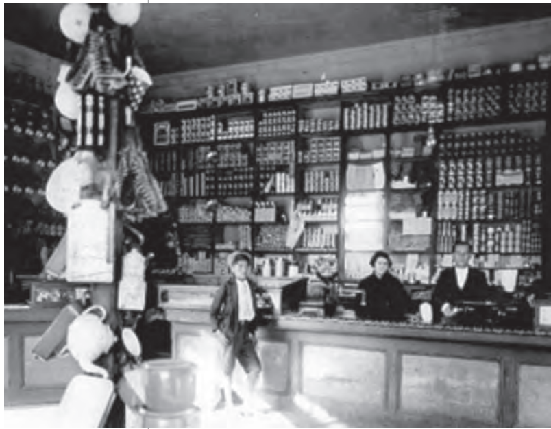
Comercio de la época

Hacia el norte se abrió la calle de Los Baños (Francisco Aranda), y bordeando el ferrocarril, la Avenida Diego Portales. Entre Portales, Pérez, San José y el callejón de Martínez (San Alfonso), se creó la población Esmeralda. Al norte, en el barrio de la Polvareda (Gran Avenida) surgió la población Santa Marta.