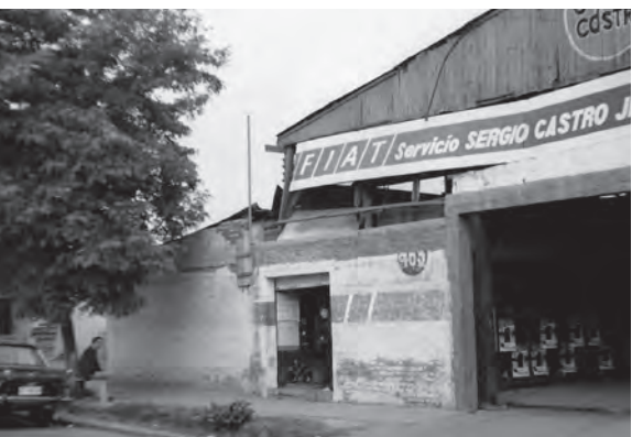
Taller mecánico Sergio Castro después del terremoto de 1985