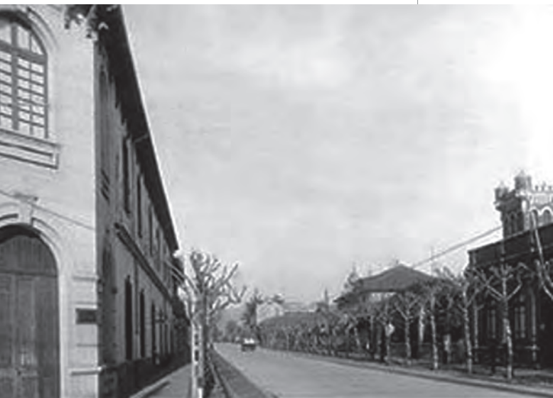
Esquina de calles Freire con Arturo Prat