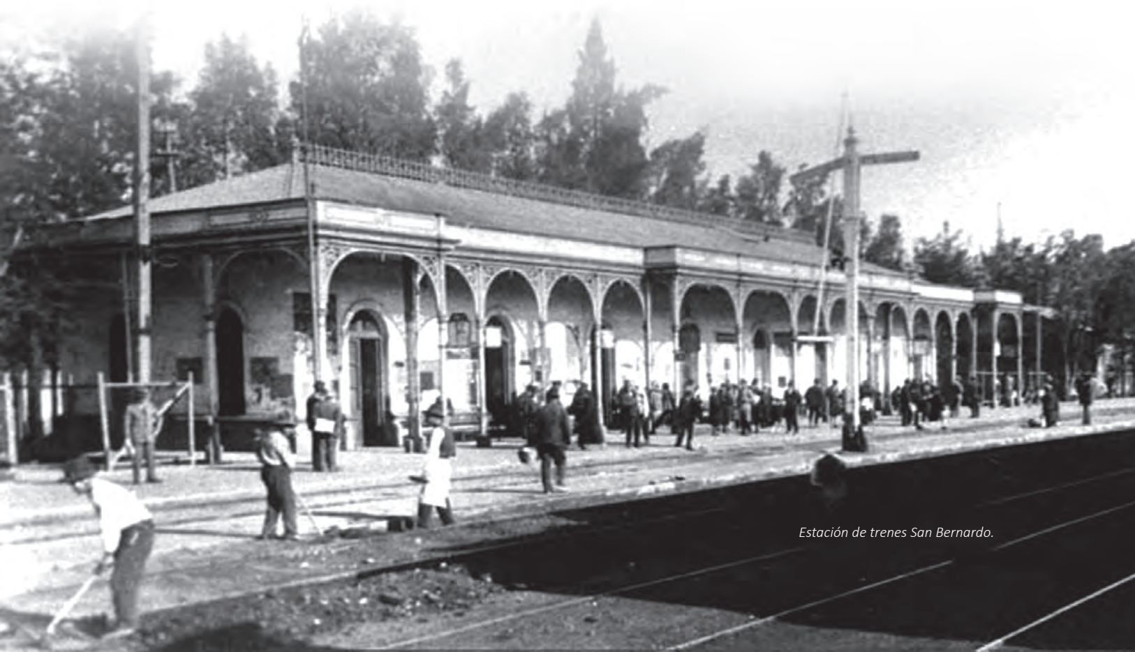
Estación de trenes San Bernardo.

Asimismo, las patentes de valor más elevado, entre 20 y 30 pesos que indica lo relativo del almacén, también se concentraban mayoritariamente en la parte urbana.