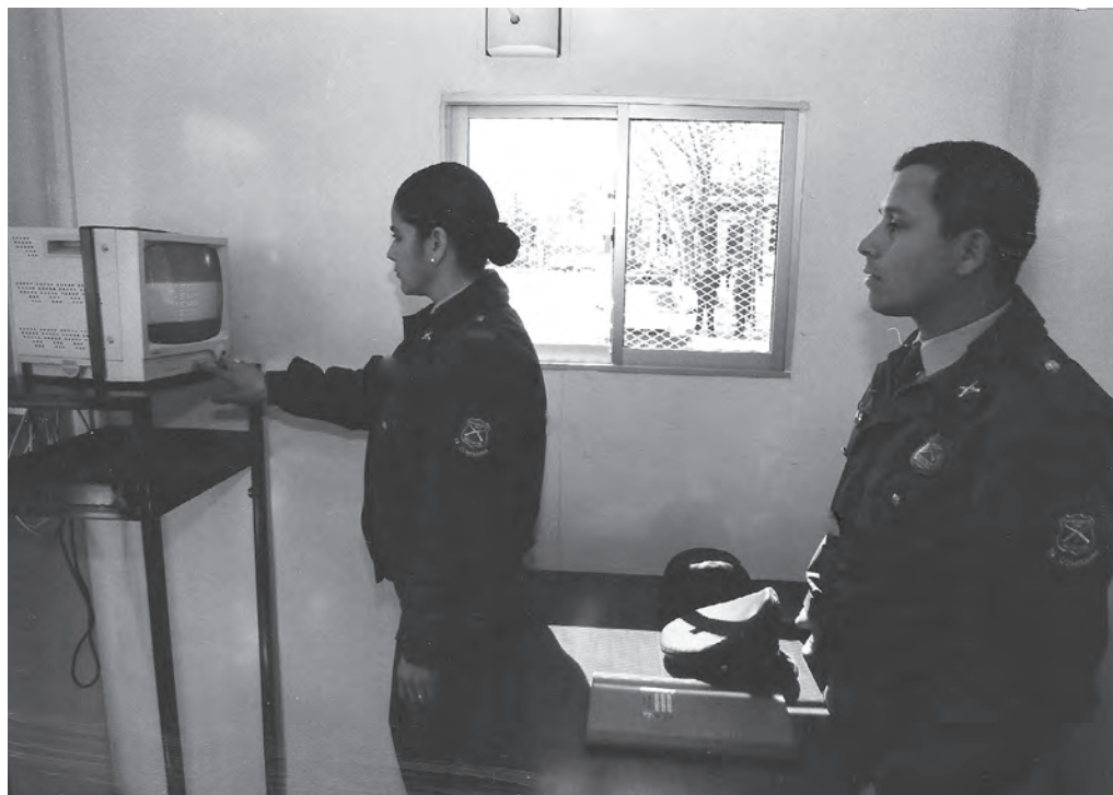
Estación Policía Dinámico (Espadin) en operaciones

En materia de seguridad se trabajó en un proyecto que se logró para mejorar el alumbrado público en calle Covadonga, esquina de calle Bulnes. Y junto con carabineros se dotó a la comunidad de un cuartel móvil, llamado ESPADIN.