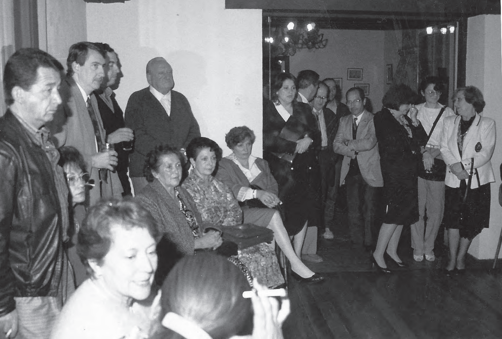
La mayoría de los comerciantes que conforman la Cámara de San Bernardo pertenecen al sector céntrico de la ciudad.

También se destaca el sentido de pertinencia y apego al sector donde se desarrolla la actividad, destacándose el hermoseamiento del centro y locales comerciales, con pintura de fachadas, luces y adornos por parte del Comercio en importantes fechas, como fiestas patrias y navidad, incluso estableciendo premios al local comercial que tenga la vitrina mejor arreglada, práctica que se venía realizando desde fines de los años 50.