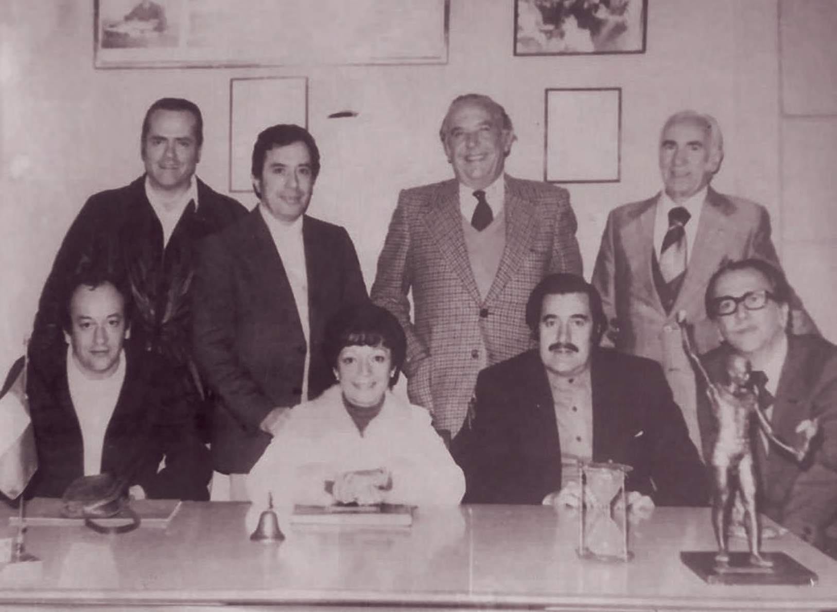
Directiva de Cámara de Comercio de San Bernardo período 1977 - 1978

Se reúnen los comerciantes de San Bernardo, convocados por los antiguos dirigentes de FECODECH, en una reunión asamblea en el Club Social de San Bernardo, para efectos de informarse respecto a la ley que crea el Registro Nacional de Comerciantes y la necesidad de estar organizados como gremio y de esa manera de forma conjunta dar soluciones a las problemáticas del sector, ya que de manera individual resulta más difícil enfrentar, y de esa forma se constituye la Cámara de Comerciantes de San Bernardo.