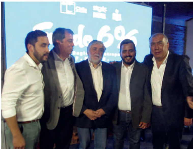
Proyecto Consejo Regional Metropolitano, CORE, Cultura.

El financiamiento de la Cámara para realizar sus actividades, esencial y principalmente son por medio de postulaciones a Fondos Concursables, como: Fortalecimiento Gremial de Sercotec, F.N.D.R., F.N.S.P., FONDART, SENCE y de otros Ministerios y Servicios, como también a organismos internacionales.