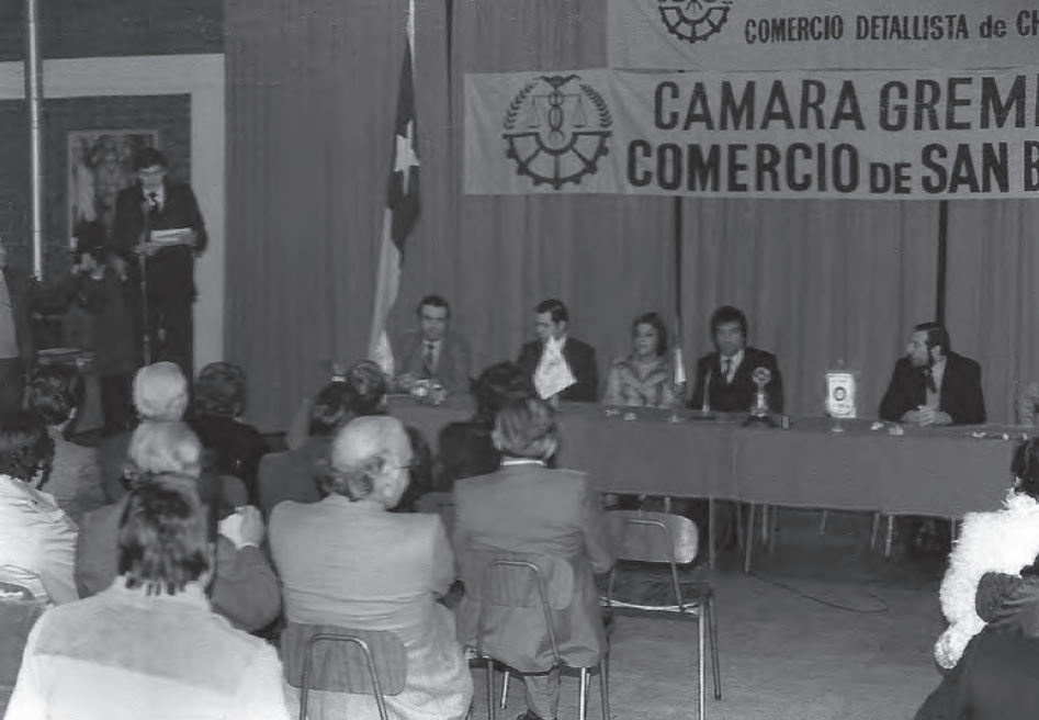
Participación de Cámara de Comercio de San Bernardo en la Confederación de Comercio