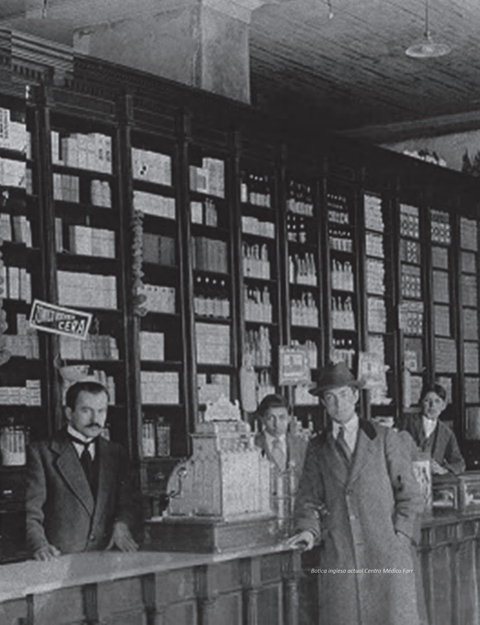
Botica inglesa actual Centro Médico Farr