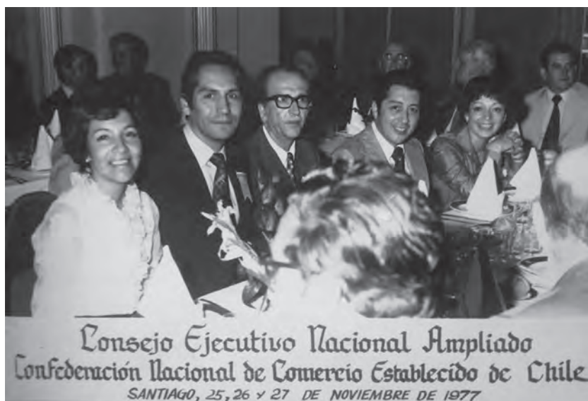
Consejo Ejecutivo Nacional Ampliado Confederación Nacional de Comercio Establecido de Chile SANTIAGO, 25, 26 y 27 DE NOVIEMBRE DE 1977

Quienes sustentan el poder gubernamental, si bien es cierto empiezan a solucionar los problemas de distribución y escasez de los bienes de consumo, no está exento de problemas el sector del comercio detallista, ya que al limitarse libertades individuales como el toque de queda, impacta fuertemente en el sector de los establecimientos nocturnos y espectáculos (restaurantes nocturnos, cabarets, quinta de recreos, compañías de revistas y otros). Sumando a lo anterior la derogación en el año 1974 del Art. 15 de la ley 17.066 de 11 de enero de 1969 que creó el Registro Nacional de Comerciantes Establecidos de Chile, el gremio del comercio recibe un duro golpe, ya que deja de ser obligatorio pertenecer a una asociación gremial para ejercer la actividad comercial, por tanto los gremios van perdiendo paulatinamente a sus asociados. Por otra parte, aumenta la cesantía generando bajas en las ventas, proliferación del comercio ilegal, aparición de ferias persas, las cuales en un comienzo son de ventas de cachureos, pero al poco andar se transforman en venta de todo tipo de artículos.