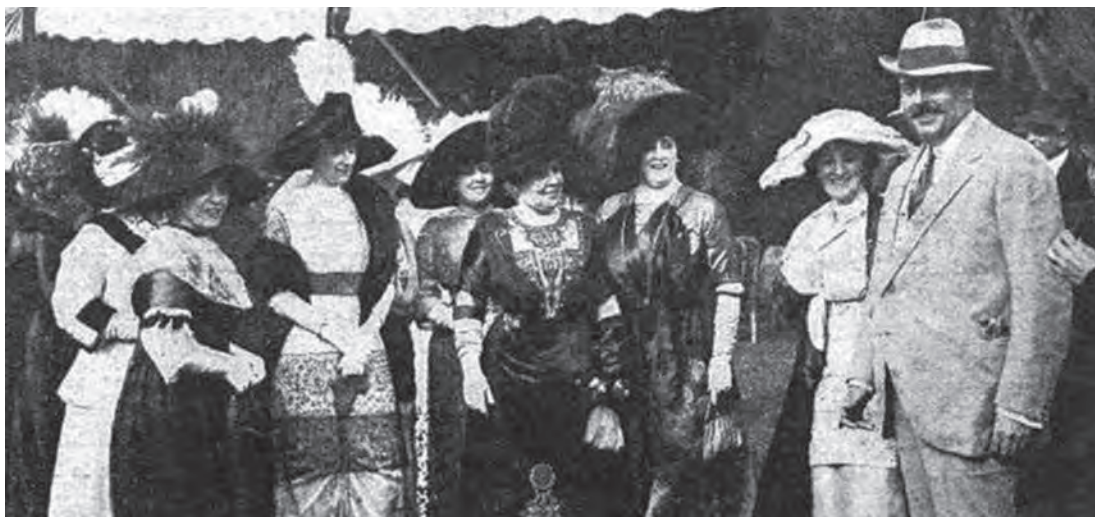
Aristocracia Santiaguina, comienzo del siglo XX

El rol que tuvo nuestra ciudad como lugar de “veraneo” de la alta aristocracia santiaguina, permitió desarrollar la oferta de bienes y servicios a estos ilustres e insignes visitantes, familias que a su vez ejercieron sin duda alguna sus influencias de poder para desarrollar su nuevo hábitat con mayores comodidades. Es así que mejora el entorno de la ciudad, creación de lugares de esparcimiento, la conectividad con Santiago, instalación de la primera Municipalidad del Departamento de la Victoria, inauguración del primer tramo del ferrocarril al sur con su respectiva estación, que contó con cinco frecuencias diarias entre Santiago y San Bernardo, instalación del telégrafo en la ciudad, contando además en el año 1887 con la inauguración de la primera línea telefónica entre Santiago y San Bernardo, sistema de agua potable y alumbrado público. Por tanto, todos estos servicios requerían de personas para su funcionamiento y ellos también necesitaban satisfacer necesidades de alimentación, vestuario, salud, transporte, entretención, educación, entre otros, lo que significaba activación y desarrollo del Comercio por medio de la demanda, creando en 1862 La Recova (Mercado) y en 1878 el Matadero, en las esquinas de la Alameda con calle de Chena (calles Colón con Avda. América).