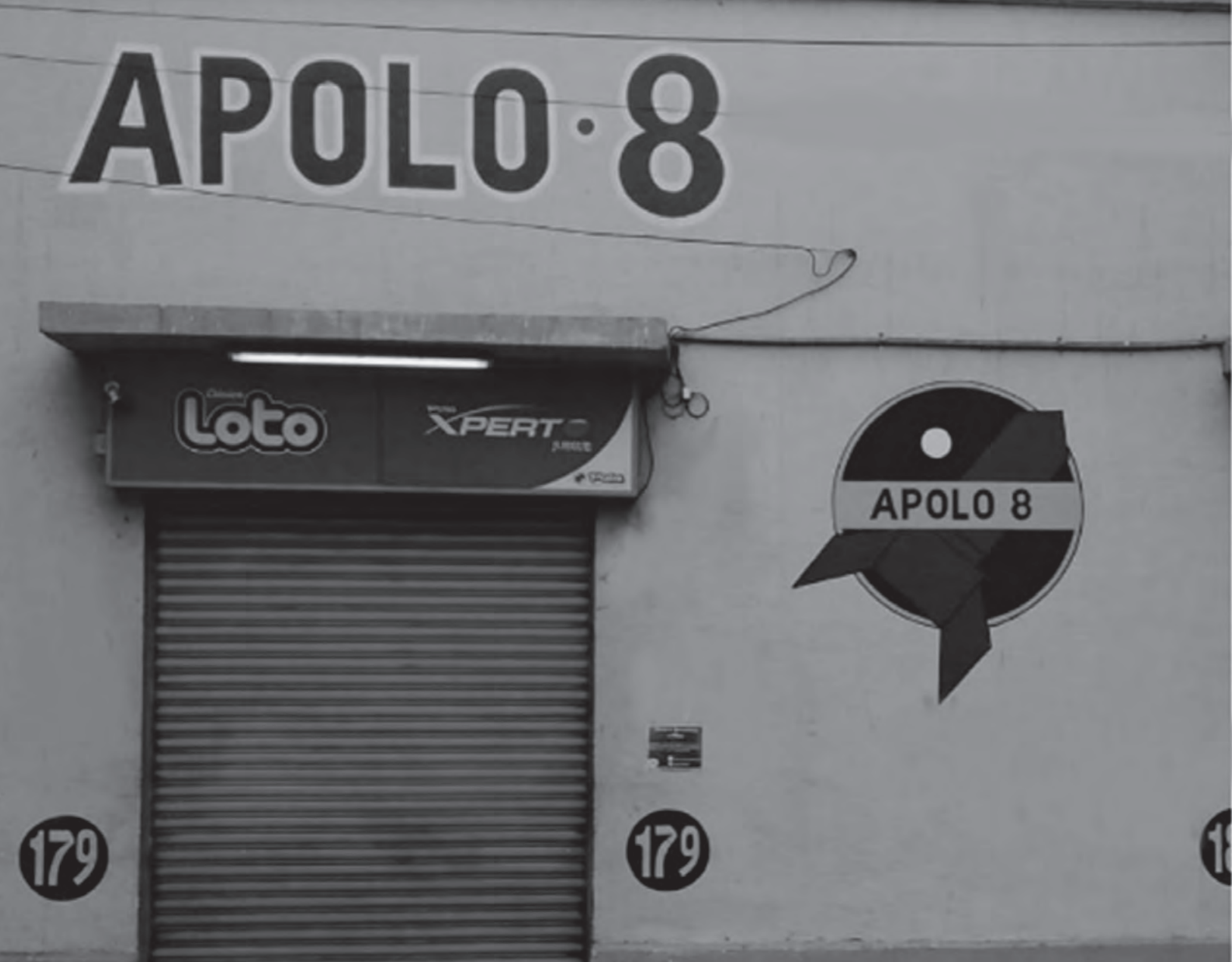
Tradicional almacén del sector Plaza Guarelló ( calle 1º de Mayo)

Si bien es cierto aún existen los negocios de barrios, la evolución que han experimentado en el tiempo, les han hecho perder muchas características de antaño, como también les han asignados otras. Hoy, en estos pequeños comercios encontramos que la tecnología ha irrumpido fuertemente y han incorporado en su gestión comercial las tarjetas de crédito y débito, dejando atrás las antiguas libretas del fiado, como también las denominadas cajas vecinas, que cumplen un rol similar a una sucursal básica bancaria.