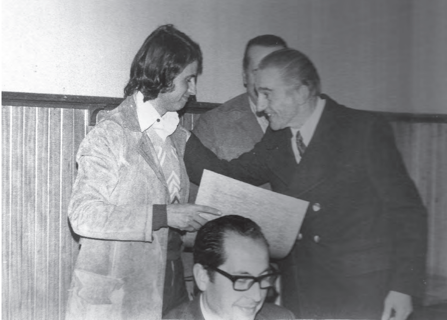
Las principales actividades de la Cámara fueron aumentar la membrecía