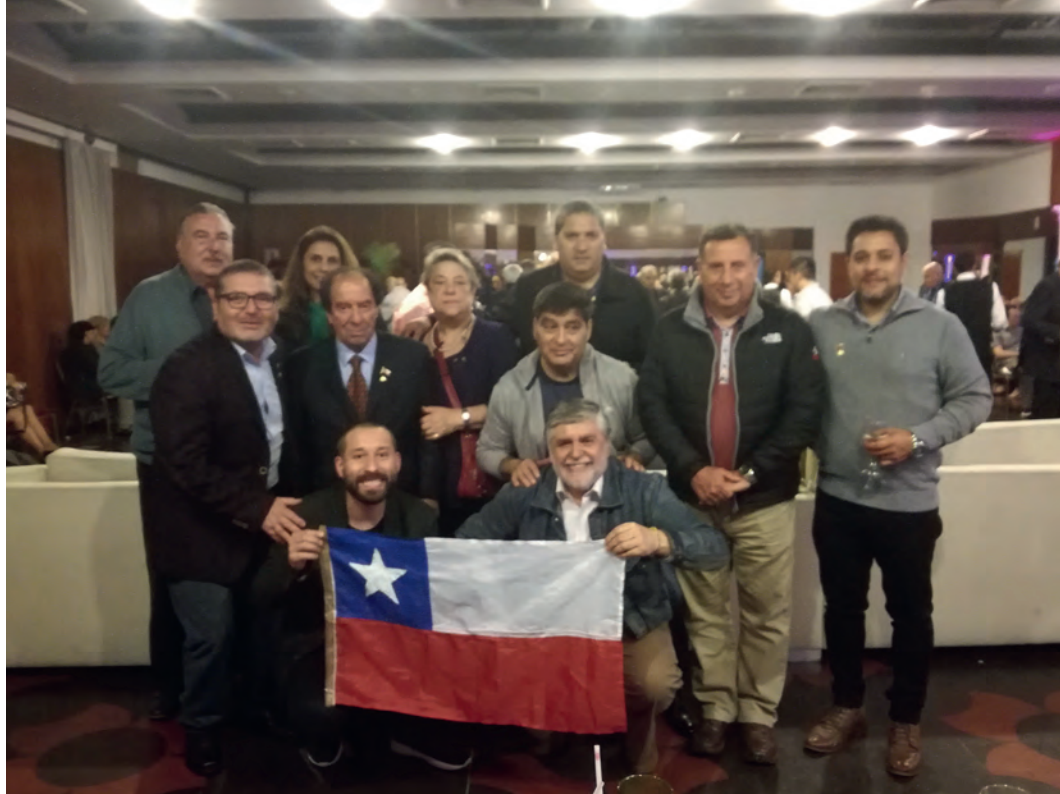
Delegación de la Cámara de Comercio de San Bernardo en el Congreso del Comercio Detallista de las Américas, Buenos Aires 2018.