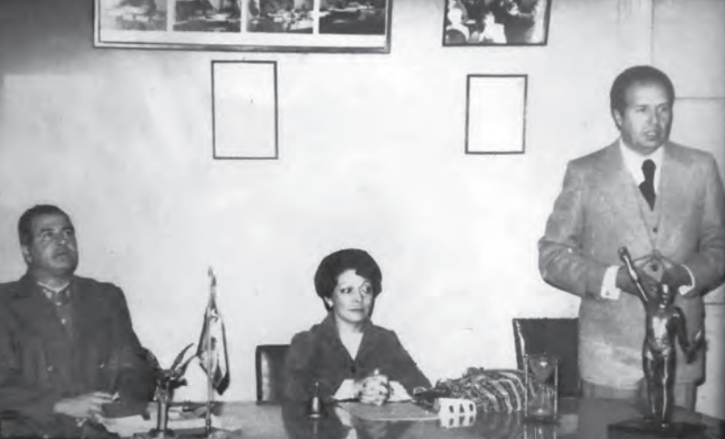
Presidenta de la Cámara de Comercio, Iris Lagos, junto al alcalde, Fernando Amengual y al gobernador provincial.