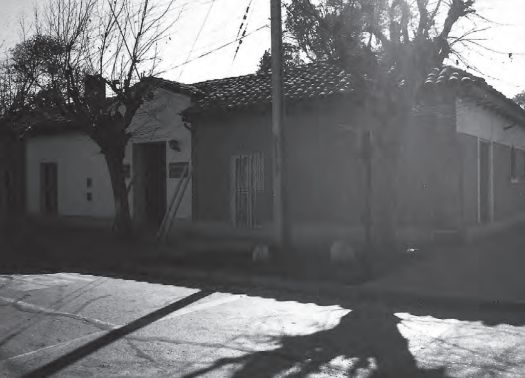
Actual propiedad ubicada en Urmeneta con Arturo Prat, adquirida en 1987